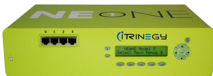
NE-ONE Network Emulator は、CD PROJEKT REDが求めている使いやすさを提供していました。

CD PROJEKT RED は、エミュレータ市場を調査し、潜在的な候補製品のリストを作成し、代替品を探し始めました。一連の話し合いとプレゼンテーションの後、スタジオは、iTrinegyのNE-ONEモデル20が推奨ソリューションになると判断しました。